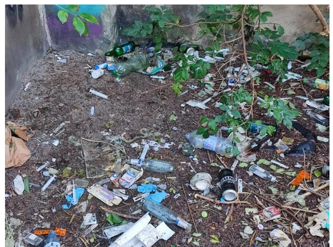
Krakowski Kazimierz, okolice ulicy Podgórskiej.

Okolice ulicy Podgórskiej: Pojedyncze strzykawki na zieleńcach i duże składowisko zużytych igieł i strzykawek w okolicach wejścia do ogrodu przy Szpitalu Bonifratrów.